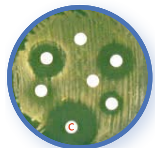
Halos de inhibición de E. coli frente a varios antibióticos (colistina (C))

para la colistina que, aún en este caso, presenta muy pocas resistencias (8). No en vano en medicina humana las polimixinas B y E (colistina) se recomiendan en infecciones sistémicas causadas por bacterias gram negativas multiresistentes (3).